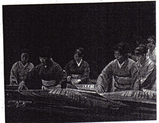
La formación está integrada por catorce componentes.

La orquesta japonesa a la que ha tenido el privilegio de escuchar el público lerreño está formada